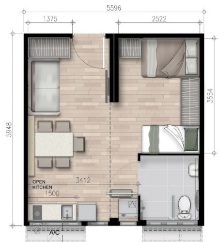
5-6人單位/無障礙單位